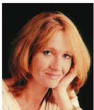
J.K. Rowling, Harry Potter y el prisionero de Azkaban.