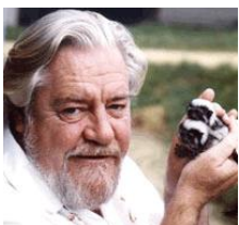
Gerald Durrell, Un novio para mamá y otros relatos.