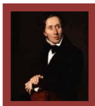
H. Ch. Andersen, La sirenita.

La primera vez que una de las hermanas recibía permiso para subir a la superficie quedaba encantadas de las cosas nuevas y bellas que podía ver, pero ahora que ya eran mayores y podían subir siempre que quisieran, se mostraban indiferentes; preferían volver a casa, y al cabo de un mes decían que su casa era lo más bonito de todo y que en casas se estaba estupendamente.